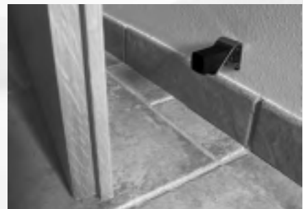
Türfeststeller für die Wandmontage für leichte Innentüren (Zwei in Eins)