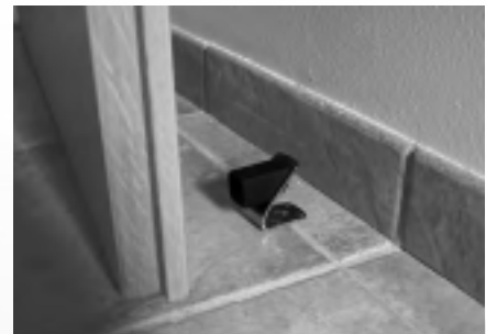
Türfeststeller für die Bodenmontage ohne Polsterung mit verdecktem Magneten (Zwei in Eins)