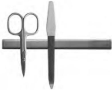
MagCap Magnetleiste „Style 110“ für kleine Utensilien