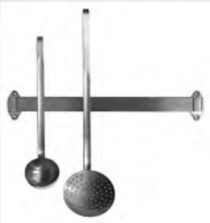
MagCap Magnetleiste „Chef“ Professionelle Ausführung mit hoher Haftkraft