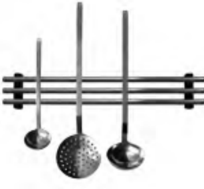
MagCap Magnetleiste „Trio“ für leichte Messer