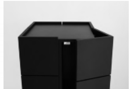
Aufschraubmagnetverschluss Elite 5 mit verchromter Metallkappe

Magnetischer Türfeststeller im neuen Design. Eine Entwicklung für Zimmertüren, geeignet zur Wand- und Bodenmontage. Bedingt durch die multifunktionale Konzeption des Montagewinkels werden zwei Einbaumöglichkeiten umgesetzt. Hervorragendes Design in Verbindung mit optimaler Funktionalität. (Seite 71)