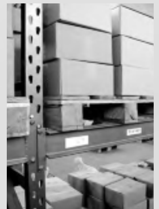
Schilder zur Lagerorganisation