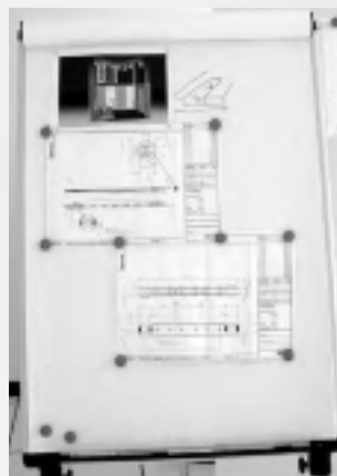
Flip - chart mit Notizmagneten für Zeichnungen