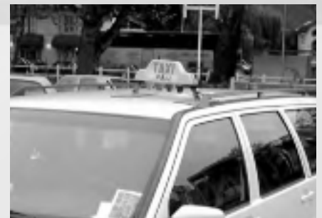
Kfz - Werbung, Schilder